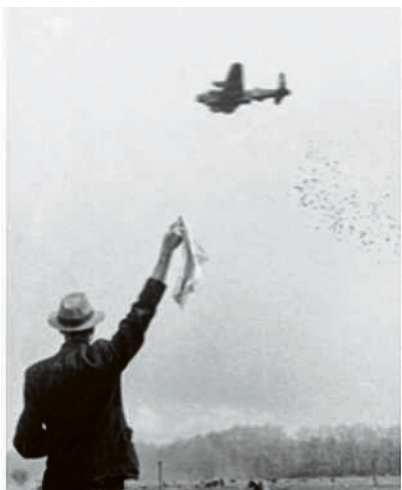
Zwaaien naar piloten / Brand Bataafse Petroleum Mij.

schijnwerpers, het geknal van het Duitse afweergeschut en het kletteren van de granaatscherven op het dak waar ik direct onder sliep, maakte me zo bang dat ik diep onder mijn dekens en kussens kroop om maar niets te zien en te horen. Maar 's morgens was je wel als eerste op straat om granaatscherven te zoeken want dat waren verzamelstukken waarmee je kon ruilen met je vriendjes. Voor mijn ouders zal het alle-