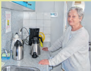
De koffie staat klaar!

Een aantal middagen in de Marmot zijn gevuld met vaste activiteiten zoals koersbal, breien en knutselen en praten over vroeger. We stellen voor de andere twee middagen in de week de oudere Goirlenaren zelf aan het woord te laten. Het zou leuk zijn om senioren de mogelijkheid te geven iets te vertellen over hun hobby, ervaring of passie of een verhaal te vertellen dat ze graag willen delen met anderen. Geen lezing of diapresentatie, maar ontspannen aan tafel in gesprek met elkaar. Zou u het eens willen proberen? Vertellen waarom jij vegetarisch eten zo belangrijk én lekker vindt of waarom postzegels verzamelen zoveel interessanter is dan veel mensen denken. U kunt natuurlijk ook de lof zingen op je favoriete vakantieoord of je toehoorders wijzen op de gevaren van de hoor-naar. Denk er eens over en als u mee wil doen, bel dan naar de Marmot en laat je gegevens achter. Een van de kernteamleden zal contact met u opnemen om verdere afspraken te maken.